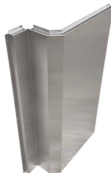
ステンレス(SUS)加工品