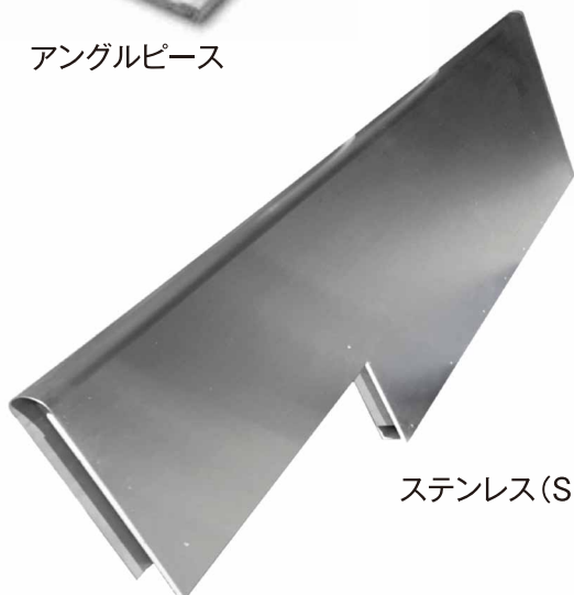
ステンレス(SUS)カウンター